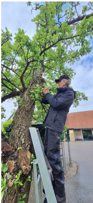
Inspectie bij terras