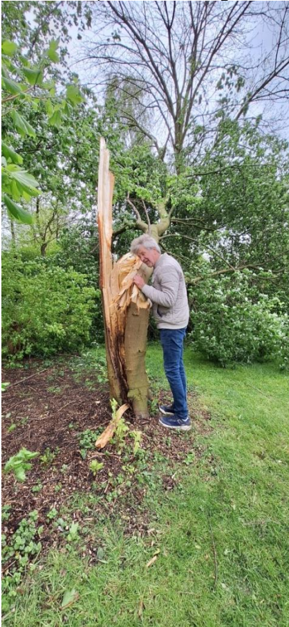
De verbaasde secretaris

Soms hebben we last van te veel wind en waait er het een en ander om. Maar er schijnen golfers te zijn die zo hard slaan dat sommige bomen het gewoon niet meer zien zitten en het opgeven. Zie hier de secretaris die bekijkt waar hij deze mooie, vroeg in het blad staande Prunus nu precies heeft geraakt.