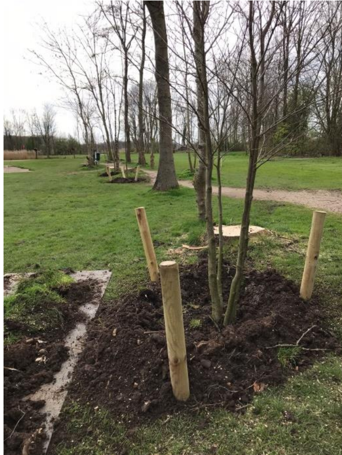
Gelukkig wordt er weer volop aangeplant.