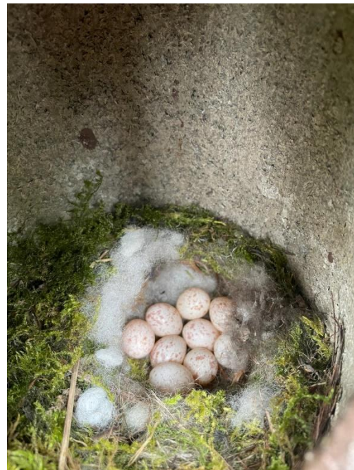
Al complete legsels