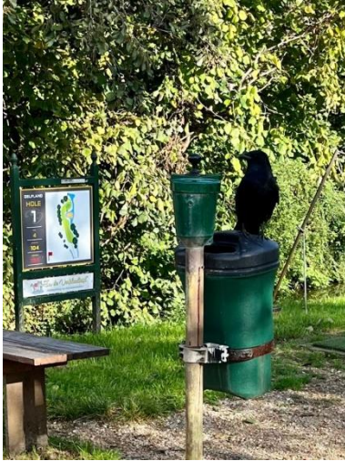
Zwarte kraai bij C1 vleermuiskast