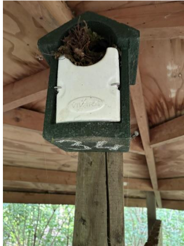
winterkoning in schuilhut