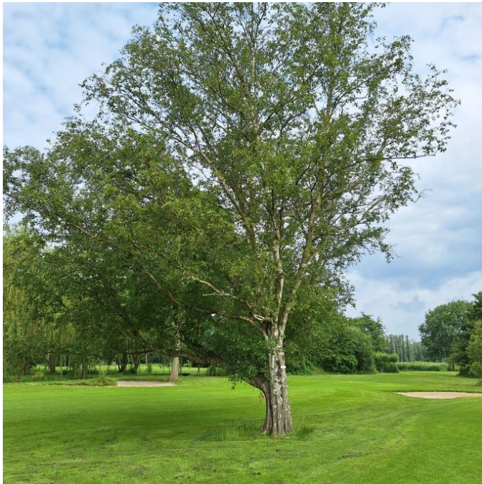
De markante berk op B6

weer op krachten kan komen. Dit compostextract zal met een speciale luchtondersteunende nevelspuit op de bladeren worden gespoten. Op deze manier kan de bladvoeding de groei van de zwammen remmen en zo het leven van onze berk verlengen.