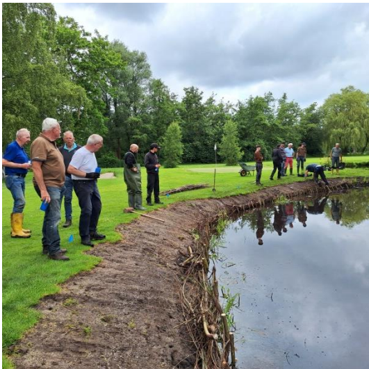
Beschoeiing en beplanting van A7