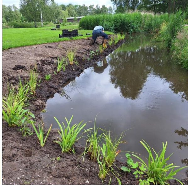
Nieuwe beplanting op A1