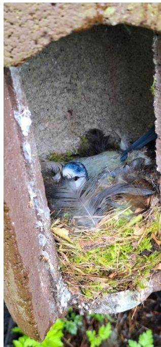
Pimpel op het nest