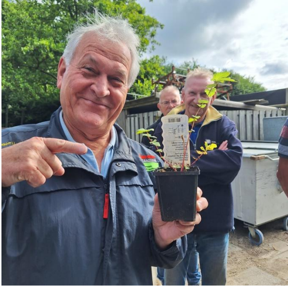
Ja ja, dat gaan we even regelen!