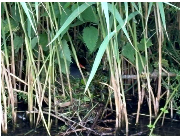
Waterkip op het nest

Een inventarisatie van de KNNV (Koninklijke Nederlandse Natuurhistorische Vereniging) liet al zien dat Schinkelshoek veel vogels trekt. Als we goed opletten tijdens het spel zien we nogal wat verschillende soorten en ook nesten. Meerkoeten, waterkippen, wilde eenden, krakeenden, ganzen, zwanen en halsbandparkieten zijn de opvallendste. Maar vergeet het mezenbestand niet, of de winterkoning, de grote bonte specht en de groene specht. Daarnaast hebben we nog de talrijke eksters, kraaien en huismussen (terras) , merels, zanglijsters, duiven en in de schuur de broedende boerenwaluwen. Allemaal vogels die zich prima thuis voelen op Schinkelshoek. Dit mede door de aanwezigheid van bomen, struiken, bloemen, bessen, insecten, nestkasten en takkenrillen waarin zij broeden of een veilig heenkomen zoeken.