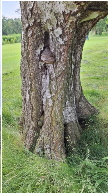
Zwammen in de stam