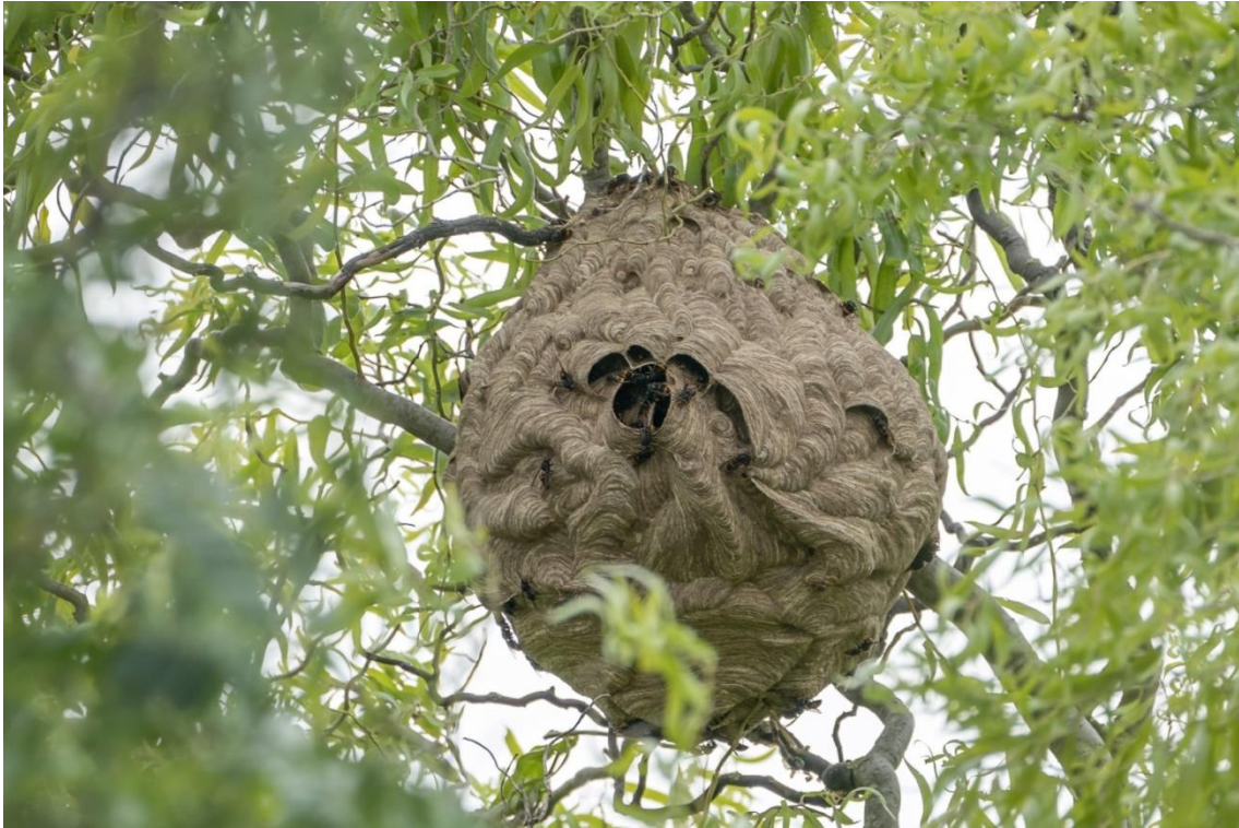
Nest van de Aziatische hoornaar