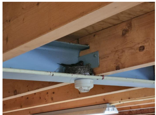
Boerenwaluw in wagenschuur